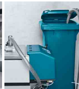
Leimgerät mit Granulatförderer